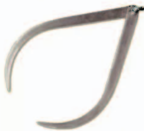
Strumenti di tassidermia