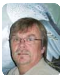
Roland Kaiser Germany